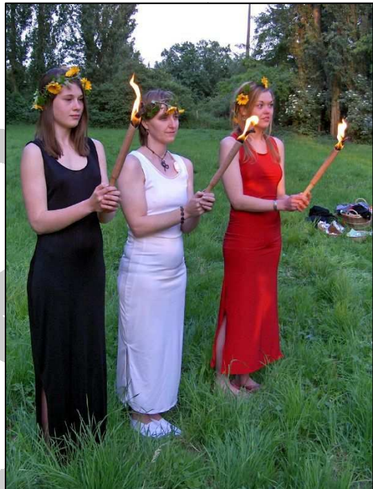
Ritueel aan het monument De Drie Tommen te Tienen ter gelegenheid van WCER - Antwerp 2005.

Ik hoop dat het nuanceverschil in aanpak duidelijk is. Overigens wens ik hier geen waardeoordeel uit te spreken; we vertrekken alleen vanuit een andere ingesteldheid. Onze beweging is van nature dynamisch . Ze past zich aan veranderende omstandigheden aan. Zo omschreef ik mezelf ooit op een colloquium van de Deltastichting als een kameleon : de kleuren veranderen, terwijl de inhoud blijft.